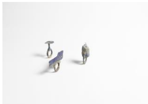
13 Felicia Mülbaier vlnr: Erdball, Luftstrom, ein Haus Ringe Lapislazuli, Gravieren, Schleifen, Bohren Maße variabel Foto: Felicia Mülbaier