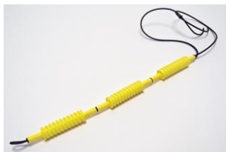
15 Claudia Nowotny, nowotny+soell Halsschmuck TIE/yellow aus der nowotny+soell Serie °look twice°, 35 cm x 2 cm x 150 cm max. Schnurlänge, Metall und Kunststoff, 2020