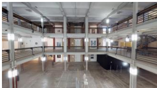
23 Kühlhaus Berlin