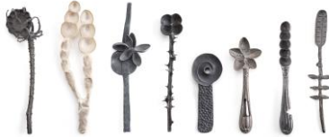
20 Gabi Veit Creatura Geschöpf Aus der grundlegenden geometrischen Einfachheit von Löffeln entsteht eine überwältige Vielfalt an Formen