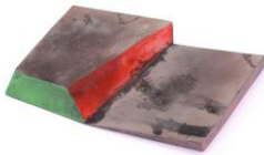
19 Antje Stutz Ansteckschmuck, Silber oxidiert, Lack montiert, lackiert, 2020