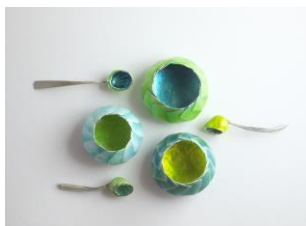
17 Eva Sörensen Salzgefäße Feinsilber montiert, emailliert