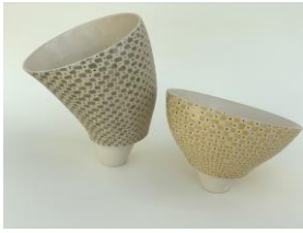
18 Susan Sting Tassen Keramik Schieflage, weißer Ton, Aufbautechnik