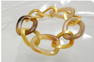
22 Rainer Wiencke Armband Büffelhorn, Sterling-Silber goldplattiert