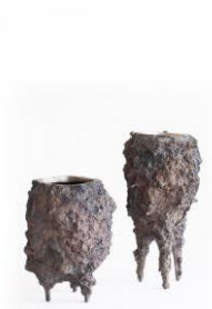
11 Ludwig Menzel Bronzen Foto: Carsten Boelter