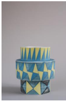
12 Helmut Menzel Vase „Tape“ blau/gelb Gedrehtes Porzellan, 2020 Foto: Helmut Menzel