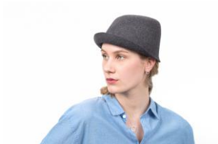
12 Nada Quenzel Kappe aus Glatthaar, Haarfilz