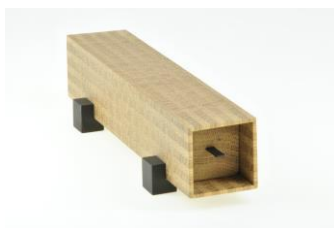
16 Richard Schillings Behältnis in Eiche 6 cm x 6 cm x 24 cm