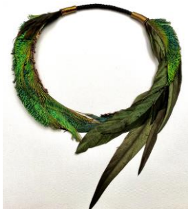
02 Gudrun Arp Kette Pfau