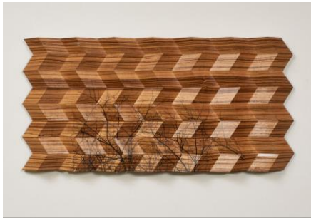
06 Michael Gerstenmayer Origami Furnierbild Zebrano mit aufgedrucktem Foto