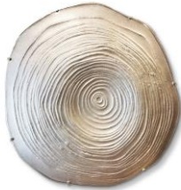
09 Gabriele Hinze Kambium Brosche