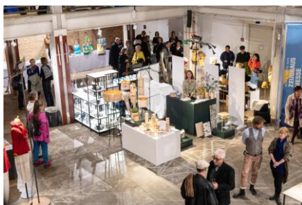
27 Zeughausmesse im Kühlhaus Berlin