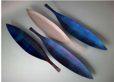
14 Juha Luukkonen Hammered steel plates for serving. Every plate has an individual color and pattern.