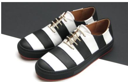
12 Claudia Opitz ADDA handgefertigter Schuh aus Rindsleder mit Gummisohle