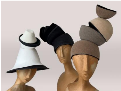
10 Karin Irmer Kappen und Hut Hasenhaarfilze