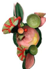
03 Dörte Dietrich Brosche aus Aluminium und Acrylfarbe Wachsausschmelztechnik