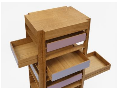
26 Martin Wilmes highboy-holz 52 x 40 x 140 cm Spiegeleiche, massiv geölt und mit Kreidefarbe belegt