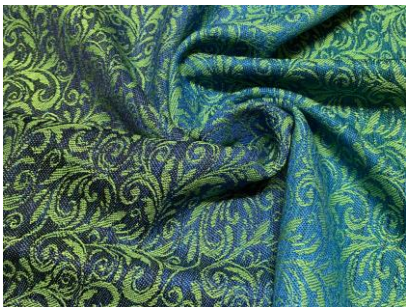
05 Sirko Galz in Jacquardtechnik handgewebte Tischtextilien aus Baumwolldamast