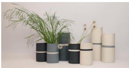
08 Juliane Herden mehrteilige Vasengruppe Porzellan (2022/2023) Höhe: 16 cm / 25 cm / 30 cm