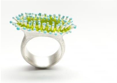
04 Martina Ege Ring Silber mit gelben und blauen Feueremaille