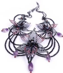
13 Nora Kovats SYBILLA IV. Collier. Emaille, Kupfer, Silber, Gold, Granat, Spinell, Amethyst, schwarze Perlen, Nylon. Handgesägt, emailliert, montiert, patiniert.