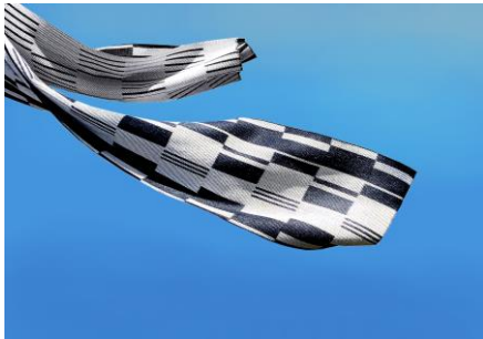
11 Ulrike Isensee Seidenschal Double Technik schwarz-weiß