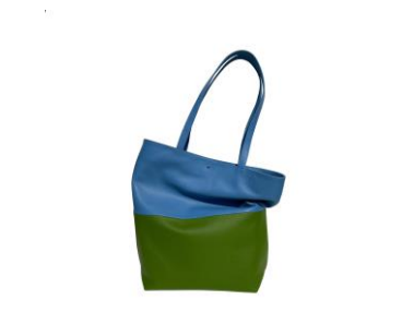
24 Sylvia Wegener Beuteltasche-blau/grün Rindnappa