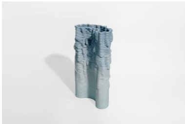
25 Babette Wiezorek Vasenobjekte aus Porzellan, Serie: States of Flux eingefärbtes Porzellan, keramischer 3d-Druck, inwendig glasiert, final auf 1250°C gebrannt