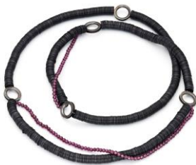
16 Luise Neugebauer Kette Pailletten Pailletten, Silber 925 geschwärzt, Granat