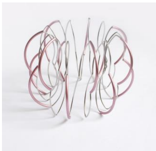
15 Friederike Maltz Armreif Federstahl Alu