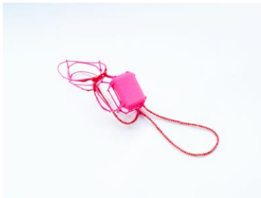
23 Lilli Veers Ansteckschmuck Silber, Papier, Harz, Farbpigmente 170 x 40 x 35 mm 2023