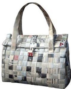
07 Luzia M. Gossmann tF-Handtasche / Handbag Zeitungsflechtwerk ca. 34 x 11 x 24